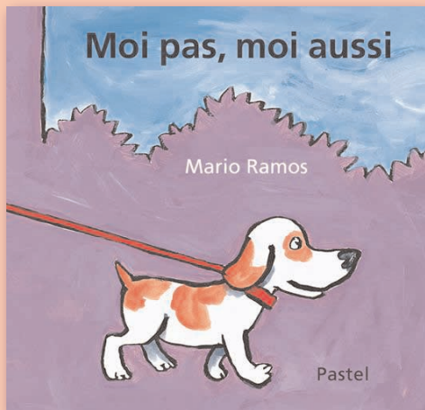
© Mario Ramos - Moi pas, moi aussi - École des loisirs

Des conseils pour mieux vivre sa nouvelle vie de parent. Il y a plein de façons de prendre soin de soi, de son couple et de son enfant.